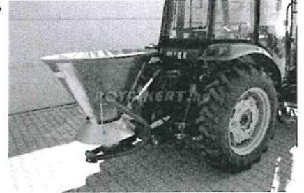
A kép csak illusztráció!

1 db Cosmo PS 500 sószóró ajánlati ár: 347 717,- Ft Áfa (27 %): 93 883,- Ft Bruttó ajánlati ár : 441 600,- Ft